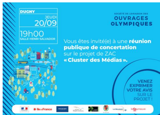
Figure 2 : Invitation