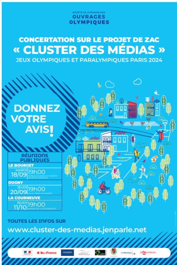
Figure 1 : Affiche