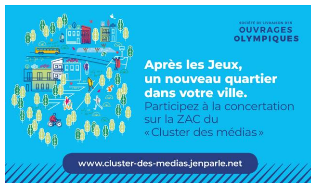
Figure 3 : Bannière web